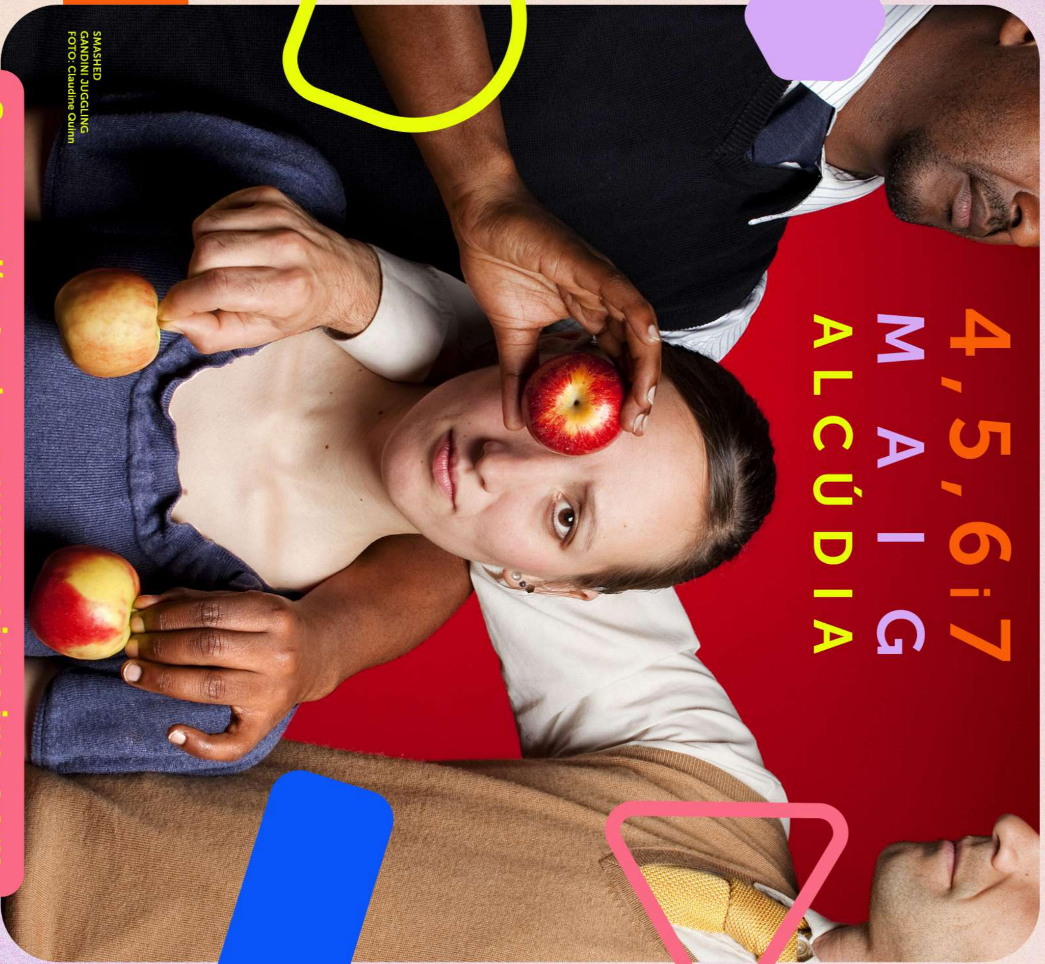
SMASHED GANDINI JUGGLING